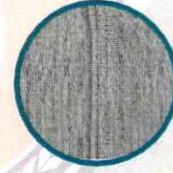
Çift iğne dikişi