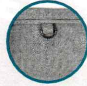
Kimlik asma halkası