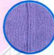
Çift iğne dikişi