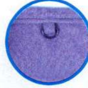
Kimlik asma halkası