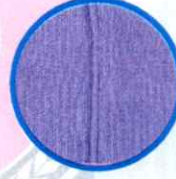
Çift iğne dikişi