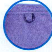
Kimlik asma halkası